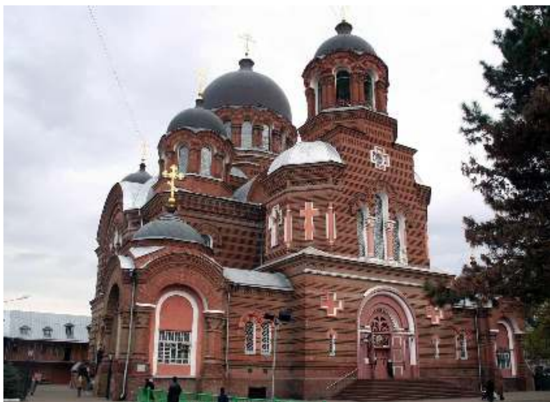
Екатерининский собор в Краснодаре – современный вид